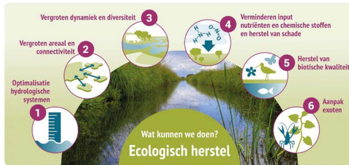
Figuur: aanknopingspunten voor ecologisch herstel volgens kennisnetwerk OBN