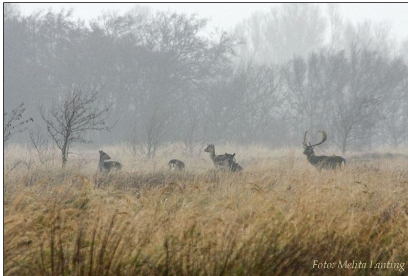
Damherten op Schouwen-Duiveland.

beschreven 11,12,23,65 , betwijfelen anderen of contraceptie wel effectief genoeg kan zijn om tegen redelijke kosten het gewenste effect te bereiken 35,100 . En hoewel contraceptie door het publiek en dierenrechtenorganisaties over het algemeen beschouwd wordt als een 'humane' methode vergeleken met de jacht 72 , is het de vraag hoe realistisch die visie is wanneer de bijwerkingen van contraceptiemiddelen op gezondheid, sociale interacties en gedrag bekeken worden. In dit rapport wordt een overzicht gegeven van de middelen die op het moment beschikbaar zijn voor contraceptie van hoefdieren, met aandacht voor effectiviteit, veiligheid en bijwerkingen. Enkele toepassingen van contraceptie in de praktijk worden ook besproken. Hiermee zal een beeld worden geschetst van de mogelijkheden en beperkingen van contraceptie voor het beheer van hoefdierpopulaties in Nederland.