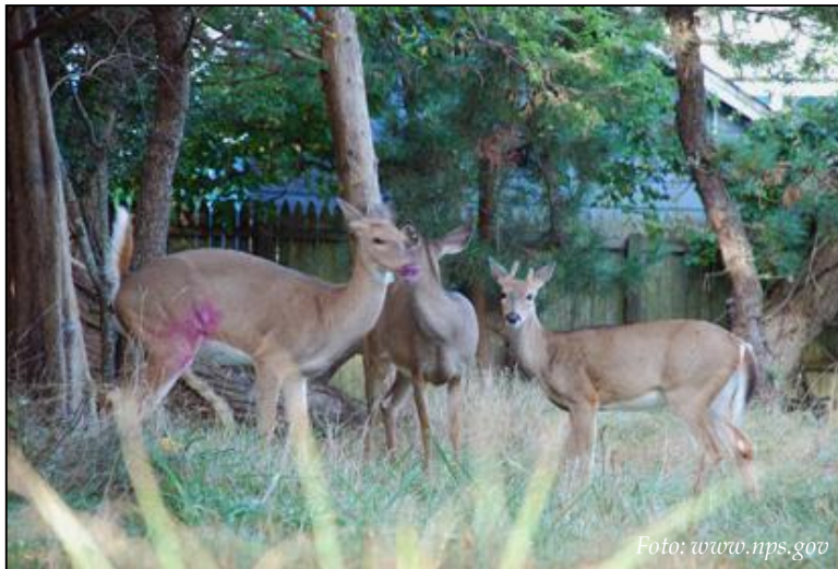
Witstaarthert dat op het achterbeen geraakt is door een vaccinatie / marker-dart.

voskoesoe (brushtail possum, Trichosurus vulpecula ) te produceren, een soort die geïntroduceerd is vanuit Australië en een plaag is in Nieuw-Zeeland 8 . Het blijkt dat het plantenmateriaal de zona pellucida-eiwitten op een of andere manier beschermt tegen vertering. Gemodificeerd voedsel is niet zelfverspreidend zoals virussen of parasieten, waardoor de toediening meer werk kost maar wel beter gestuurd kan worden en dus veiliger is. Ook bij het neerleggen van voedsel is het echter moeilijk te controleren welke dieren ervan eten.