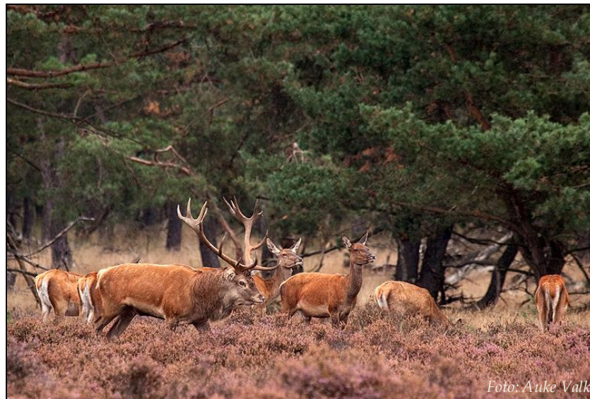
Edelherten op de Veluwe.

Een nadeel van leuprolide is de relatief hoge kostprijs. Eén behandeling kost $150-200 per dier, dat is 6 tot 8 keer zoveel als bijvoorbeeld PZP (zie 5.2), maar kan wellicht iets omlaag gebracht worden als er lagere doses gebruikt worden. Een ander nadeel kan zijn dat GnRH-agonisten soms eerst een sterk stimulerend effect hebben op de hormoonconcentratie van LH (de 'acute fase') die enkele dagen tot weken kan duren en spontane oestrus kan veroorzaken, voordat de hormoonconcentraties onderdrukt worden 43 . Echter in de studie aan edelherten duurde de piek in het niveau van LH slechts enkele uren. Na 16 uur was LH terugggevallen tot minimale concentraties, zonder oestrus te veroorzaken 4 . Dit geeft de suggestie dat het optreden van een acute fase in de praktijk geen beletsel hoeft te vormen voor het gebruik van leuprolide.